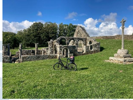
CHAPELLE DE LANGUIDOU

Tu as deux jours libres, le week-end par exemple et tu veux découvrir ce qu'il y a en dehors de Douarnenez et du Cap Sizun? Tu peux louer une voiture ou prendre la tienne si tu es venu en voiture (Sans permis de conduire c'est difficile dans cette région. ...)